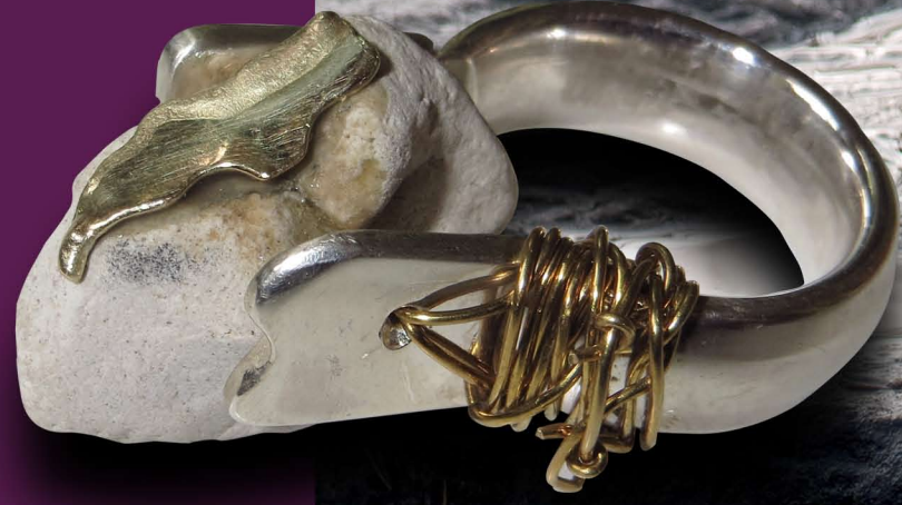
Aurum Hühnergötterstein, Goldplatte, vergoldeter Draht, Silberschiene, 3fach tragbar