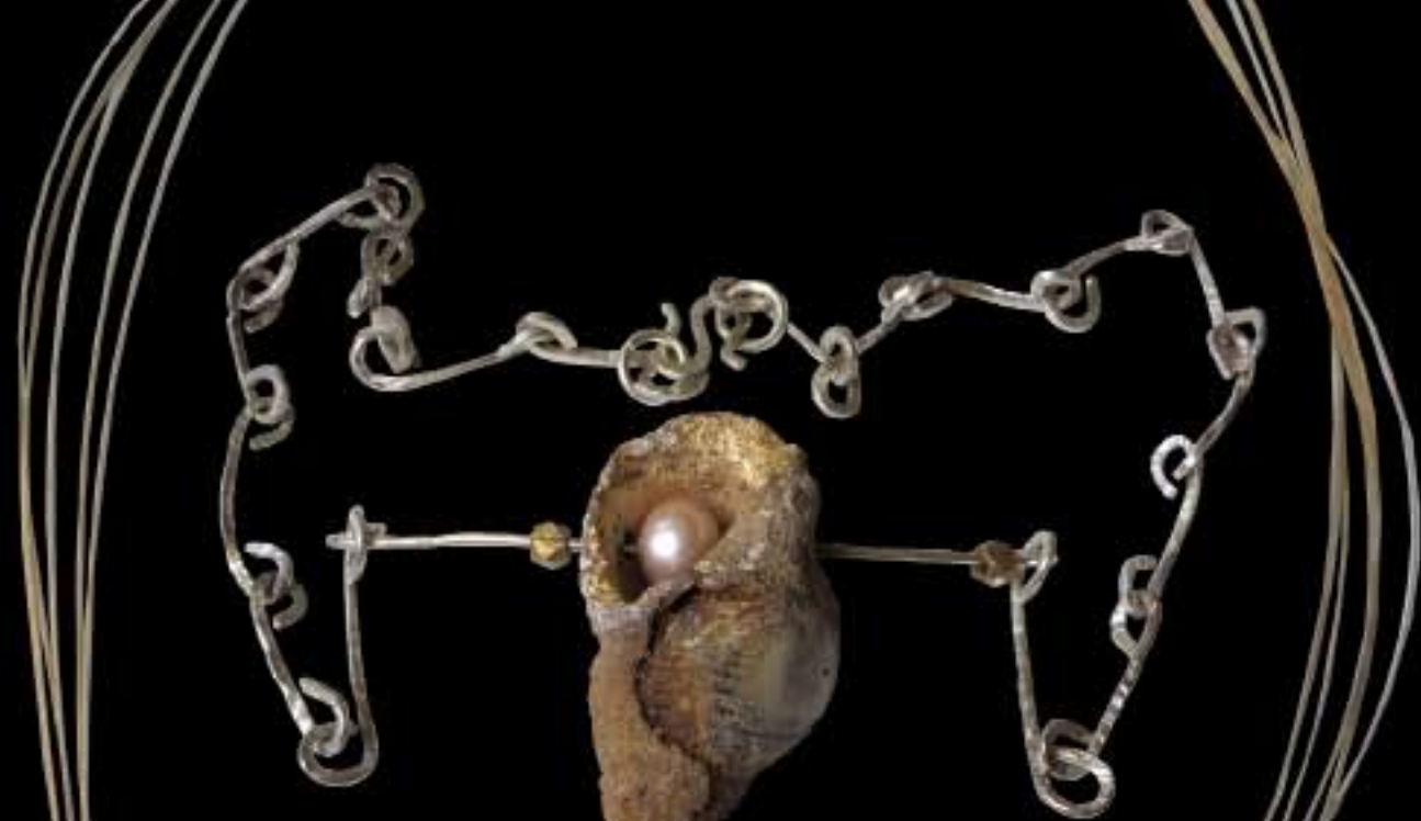
Aphrodite Well hornschnecke, Goldblatt, Perle, Silber, geschmiedete Silberkette