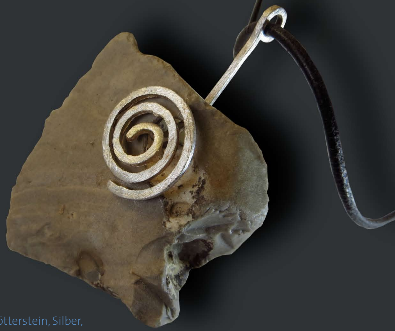
Fous Hühnergötterstein, Silber, Lederband