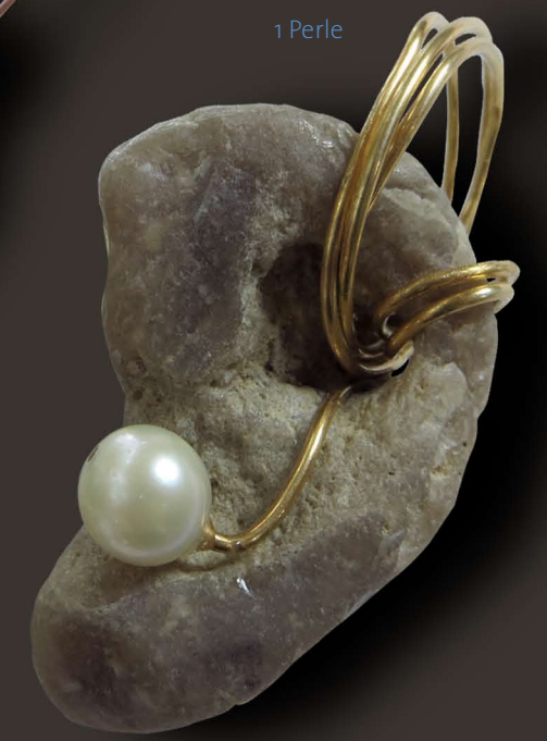
ohr les olin Hühnergötterstein, Golddraht, 1 Perle