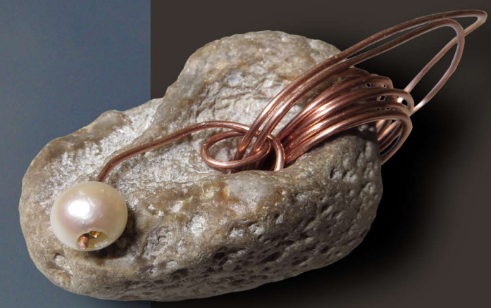
Phaeton Hühnergötterstein, Kupferdraht, 1 Perle