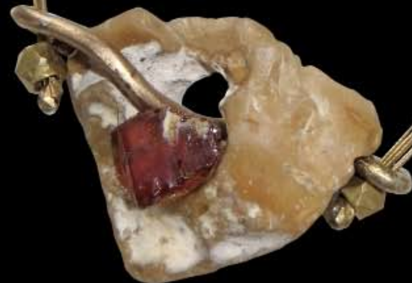
Artemis und Apollon Hühnergötterstein, Bernstein, Messingrohr, Messingdraht, Messingkapseln