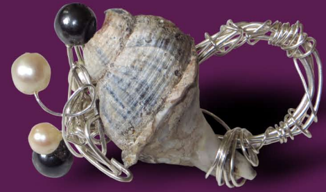
Lit Wellhornschncke, Silberdraht, 2 Perlen, 3 Granate