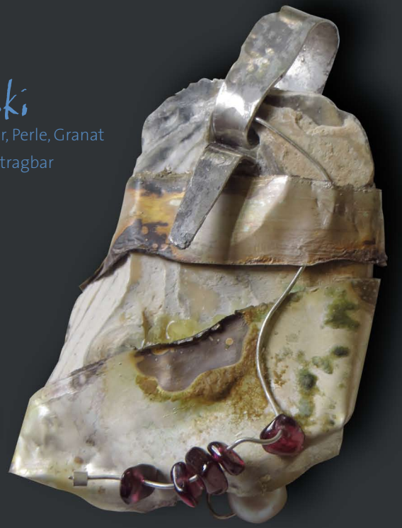
Loki Muschel, Silber, Perle, Granat 2seitig tragbar